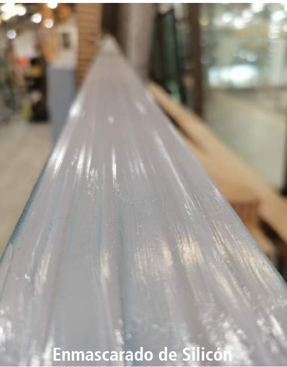
Enmascarado de Silicón