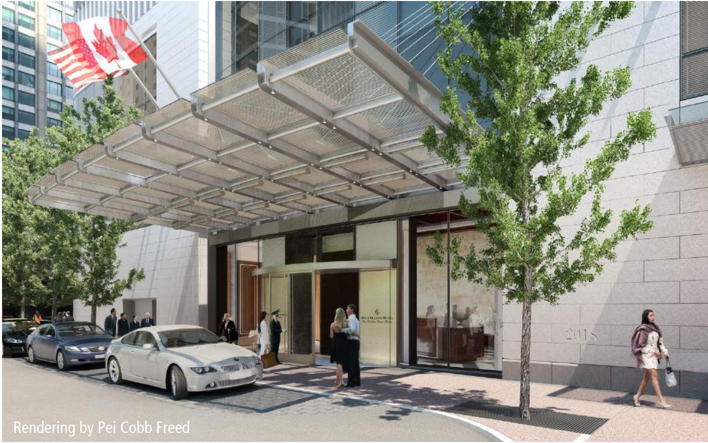
Rendering by Pei Cobb Freed